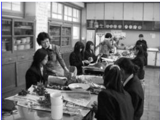
指導している様子

「野菜の即売のお手伝い」即売用のポスターづくり、値段表づくり、菊の花のパック詰め、レジ係、試食をすすめたり、たくさんお手伝いをしました。