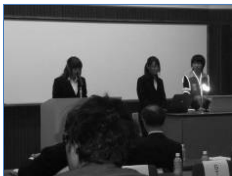
学生ボランティアサークルによる活動事例報告(安全ボランティア)

今年度から、小学校教職課程も開始されたとのことで、支援センターとしましても町田市全体の学校とも連携を深めていただくため行動していきたいと考えております。